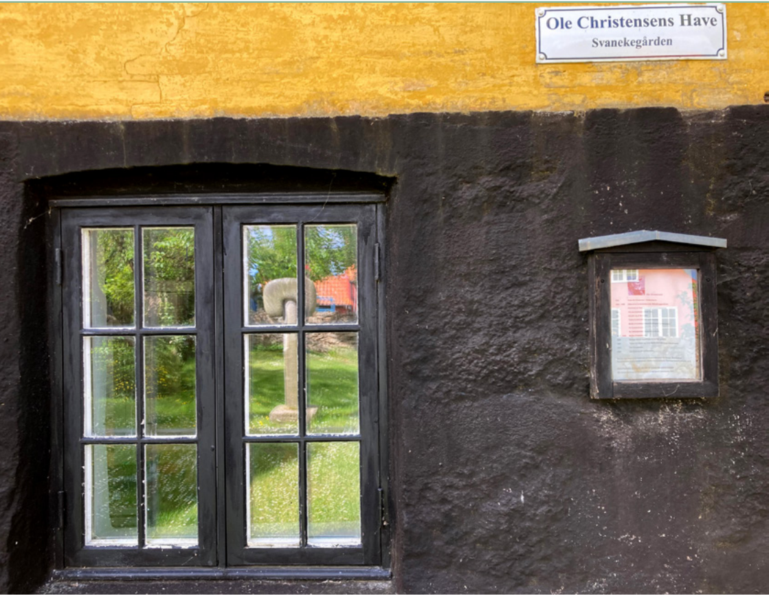
Svanekegaardens have