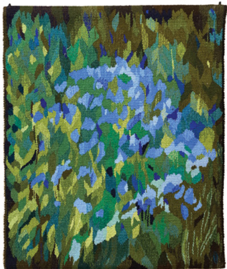
Kærmindesøster - Br. 73cm, h. 85cm - Gobelinvævning i hør og uld.

Mine vævninger er inspireret af naturen. Jeg tegner, maler og fotograferer i naturen. Himlen, havet, skoven og haven, derefter bruger jeg mine tegninger som forlæg til mine vævninger. Jeg lader ofte mine tegninger/ billeder ligge rigtig længe, når de så bliver taget frem igen, ser jeg nye ting i dem. Tegnet om sommeren, vævet om vinteren. At male og væve er to forskellige måder at skabe billeder på, men det at male motivet først, derefter beskære det, er for mig en god proces. Jeg kopierer ikke maleriet, men bruger det til inspiration.