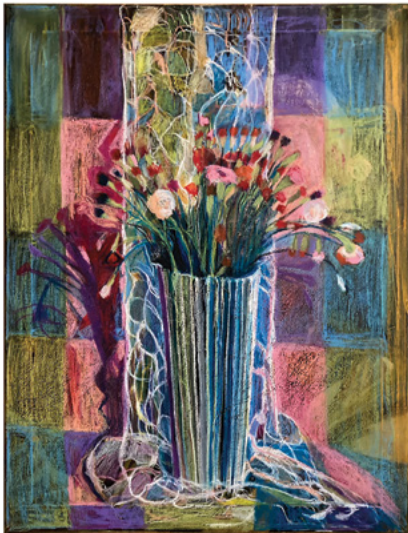
Les Fleurs Rouges - 60x80 - akrylmaling og oliepastel på lærred.

Jeg arbejder med akrylmaling og oliepastel på lærred. Mine malerier er både konkrete og abstrakte og får ofte en oversanselig dimension. Jeg inspireres af smukke former og farver, lyset der falder ind, som i en prisme. Jeg elsker at kombinere former, farver, stoflighed og dynamik til et intenst udtryk. Jeg elsker at gå på opdagelse i lys og skygge, lysindfald og farve-skønhed. Som en poet der vandrer rundt i en fortryllet verden - som en forsker der undersøger sit stof - som en danser der forsøger at gribe alle farver i øjeblikket hen over lærredet.