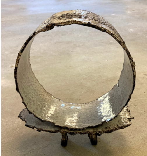
"MA" 2023 - h 29cm b 25cm d 10cm - sort stentøjsler med hvid glasur

Jeg arbejder først og fremmest med ler i abstrakt form som giver mig frihed til bevægelse indenfor et ellers traditionsbundet håndværk. Processen starter med en tanke, en følelse eller et ord som jeg siden konkretiserer til noget skulpturelt. Inspiration finder jeg i sprog, filosofi og enkelt ståendelementer i forskellige kulturer.