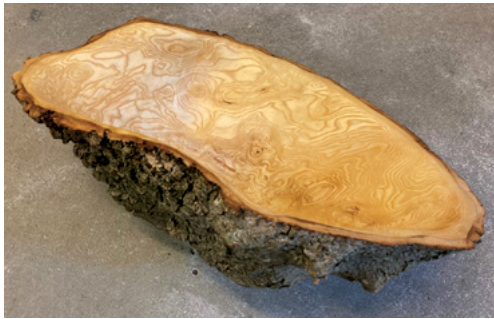
Livets skål - Asketræ & Pæretre

Jeg arbejder med bla. bornholmsk asketræ, frugttræ og birketræ.