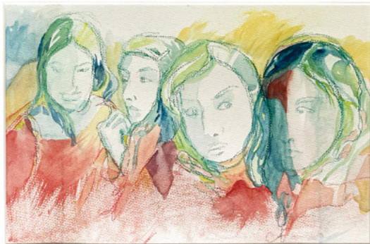
Med eller uden tørklæde - 40x50 cm Gouache & akvarelkridt på papir, Ramme i bøg, museumsglas

I atelieret er jeg på jagt efter skønheden i den turbulensagtige samtid, vi lever i.